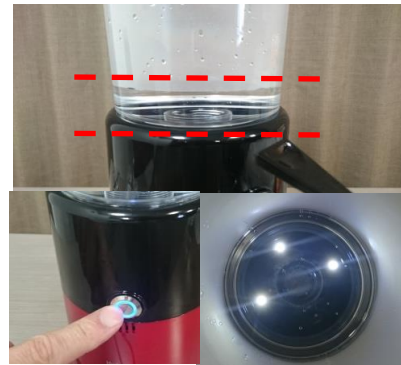
④電源スイッチを入れ30分間作動(水素発生)