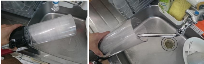
⑤30分経ったらクエン酸液を捨て水道水で2~3回濯ぎます ※蛇口内部もコックを開いて水通します。