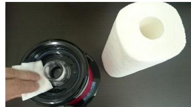
⑧本体内部はキッチンペーパー等でふきあげます