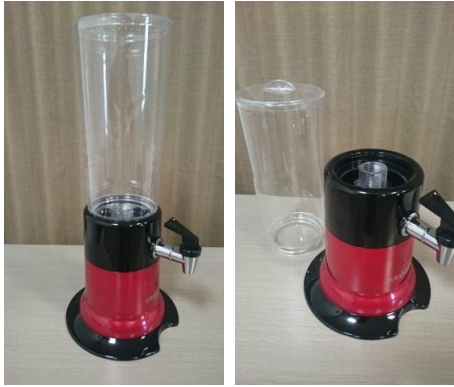
①ディスペンサー(水槽)部を空にして外す