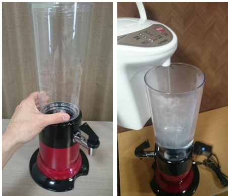
③水槽をセットして沸騰したお湯(水道水可)を注ぎます