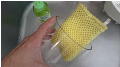
⑦水槽部と蓋は中性洗剤で洗い水道水で濯ぎます