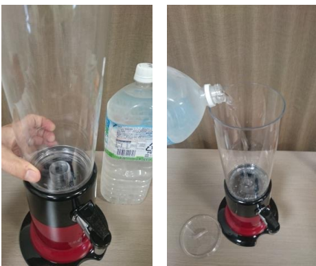
⑨水槽をしっかりと装着しミネラルウォーター または浄水器で残留塩素を除去した浄水を注ぐ ※1日で飲みきれれる量を注いで下さい(水質維持)