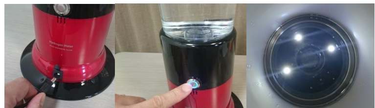
⑩電源スイッチを入れる 30分後に1000ppmの水素水が出来上がります ※水の温度、種類性質により時間がかかる場合もございます

※下記、ホームページより動画もご覧いただけます。 株式会社KYコーポレーション水素水事業部 ( http://genki-suisosui.jp )