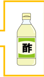
②水素発生装置に市販のクエン酸を1~2ティースプーン入れます(約小さじ1杯分) ※汚れが少ない場合は同量の【酢】でも十分に洗浄可能です。